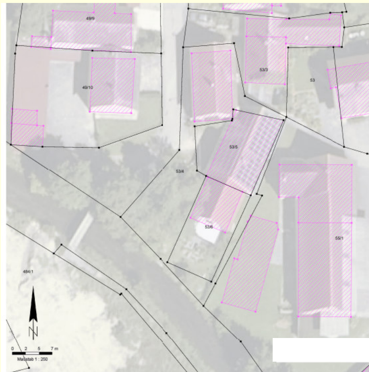
Besitzstandskarte mit Orthophoto im Hintergrund